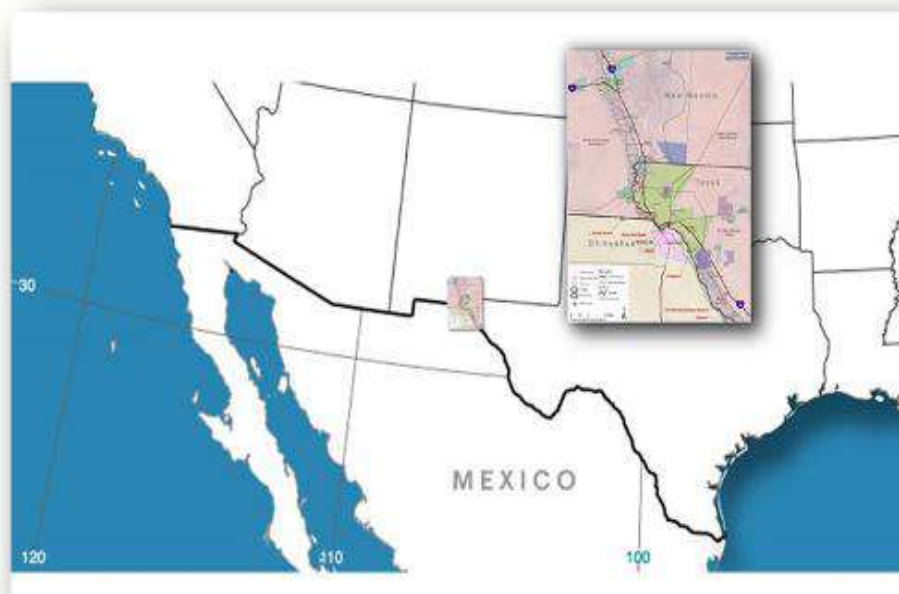
Figura No. 2. Croquis de ubicación de la región transfronteriza Paso del Norte

Mapa no a escala