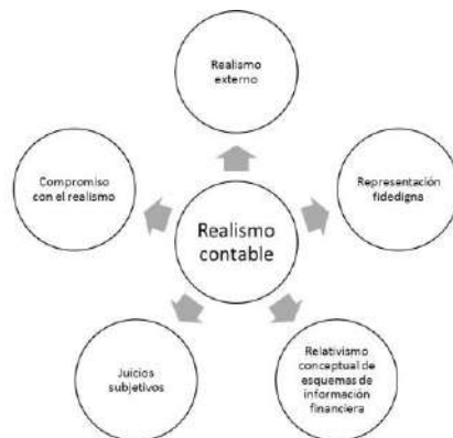
Gráfico 2 Supuestos del realismo contable

Continuando con este hilo discursivo, se evidencia el desarrollo de cinco posturas frente al realismo en la doctrina contable planteando cuestiones diferentes en términos de representación de la realidad (ver gráfico 2).