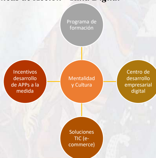
Ilustración 4 Líneas de Acción - Ruta Digital