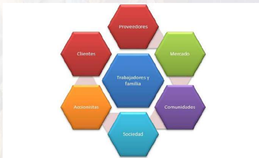
Ilustración 2 Grupos de interés de las empresas Socialmente Responsables

Las empresas textiles antioqueñas, deben trabajar de manera responsable como cualquier tipo de organización con la sociedad, para así lograr un desarrollo sostenible gracias a la armonía que debe existir con los diversos grupos de interés, logrando con ello la creación de valor tanto económico, como social y ambiental. En la ilustración que se presenta a continuación se relacionan los grupos de interés existentes que deben ser prioridad de igual manera para las empresas textiles: