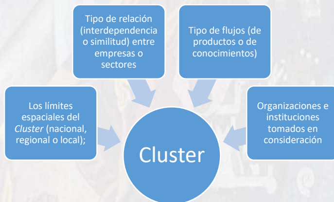
Ilustración 1 Factores de valor en el cluster