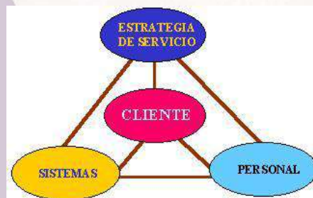
Figura No. 1 Triangulo del servicio

Por ejemplo: en el modelo del triangulo de servicio ver figura No.1 se muestra como es necesario tomar en cuenta que las empresas son muy diferentes por lo tanto no pueden existir fórmulas generalizadas, aplicables a todos por igual.