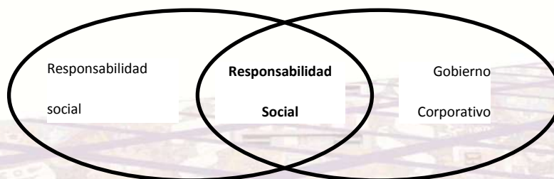
Figura 1. La responsabilidad social y el GC

Cualquier miembro de una sociedad está obligado a ser socialmente responsable, su comportamiento debe ser tal que conscientemente actúe en pro de la perpetuidad de la sociedad. En el caso de las organizaciones, la conciencia de sus actos RSO reside en su sistema de GC donde se deciden las formas y tiempos de su ejecución. La figura 1 representa que la forma particular de responsabilidad social en las organizaciones, depende y se entrecruza con su GC.