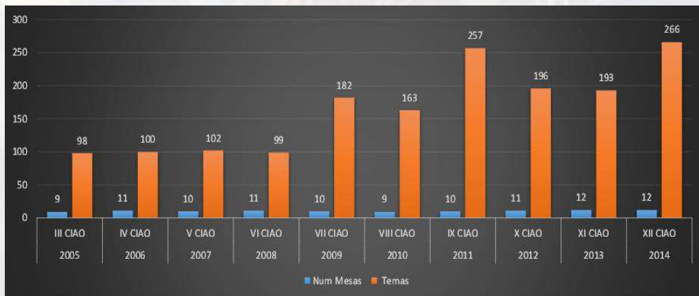
Gráfico 3. Número de mesas de trabajo y número de temas por año y por congreso CIAO 2005-2014

Congreso CIAO. En la gráfica 3, se muestra tanto el número de mesas por congreso como la cantidad de temas o investigaciones que se presentaron en cada mesa, cabe mencionar que el análisis realizado fue del 2005 al 2014, ya que en la página solo se presenta la información de dicho periodo, es decir a partir del tercer congreso y hasta el décimo segundo. Destaca que el noveno congreso en el año 2011 y el décimo segundo en el 2014, son los que registran una mayor cantidad de participaciones de investigadores. Del 2005 al 2008, la participación era de 102 investigaciones, lo cual puede llevarnos a analizar los motivos de esta escasa participación, sin embargo, éste tema puede quedar pendiente para una segunda fase del presente trabajo.