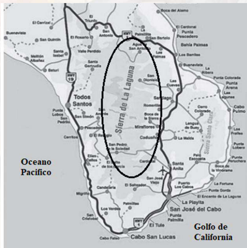
Figura 3 Localización de la Reserva de la Biosfera Sierra La Laguna

El uso de los recursos naturales en la zona de amortiguamiento de la REBISLA, se ha centrado en el aprovechamiento del agua, la flora y fauna regional; solo en los últimos diez años ha existido interés por impulsar el turismo de naturaleza, por lo que esta actividad aún se encuentra en su fase inicial (tomando como referencia la teoría del ciclo de vida del producto turístico), por lo que no se ha desarrollado formalmente como actividad empresarial, dado que siguen prevaleciendo una serie de factores que limitan su desempeño.