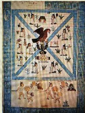
Figura 2 Códice Mendocino

La traza urbana de Tenochtitlán revela la cosmovisión que del universo tenían los aztecas; dividieron el terreno en cuatro secciones o barrios que eran los cuatro rumbos del universo: Atzacualco, Cuepopan, Moyotlan y Teopan. Morante (2000) 17 hace referencia que para el hombre prehispánico el cosmos contaba con tres planos horizontales, cielo (con trece niveles), tierra e inframundo (con nueve estados), en cada uno se contaba con cuatro secciones y una quinta o central, donde se equilibraban las fuerzas cósmicas y era considerado un punto de gran importancia porque por ahí se podía acceder verticalmente a los tres planos horizontales y además es el centro del universo, donde se equilibran y concentran las cuatro épocas, los cuatro colores, los cuatro desdoblamientos de los dioses telúricos. La traza urbana de Tenochtitlán, es un claro ejemplo de lo anterior (ver figura 2, Códice Mendocino).